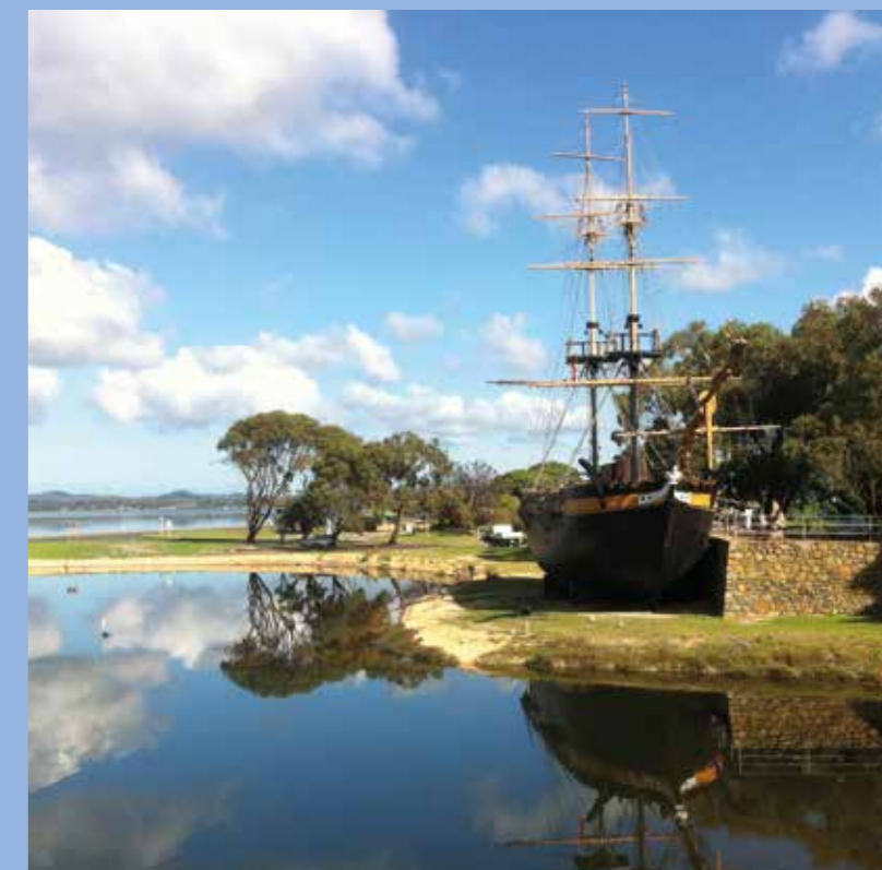
Копія Бріг Еміті, яка вперше прибула в Олбані в 1826 році

У центрі моряків Stella Maris WIFI є безкоштовним для мореплавців з необмеженою кількістю даних і швидким з'єднанням.