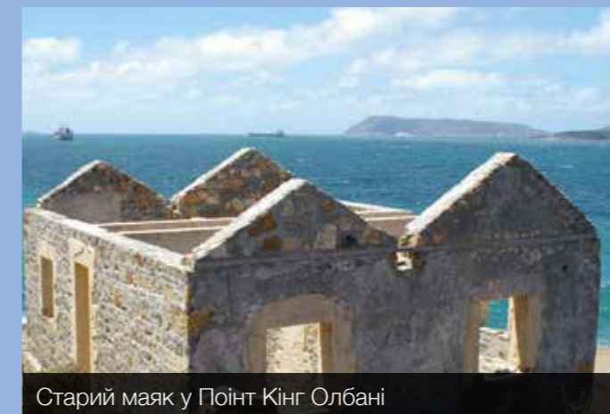
Старий маяк у Поїнт Кінг Олбані

Є два автобуси, що надаються Stella Maris, що прямують від кораблів до центру з 10:00 до 17:00 щодня і один раз на годину з 18.00 до 22.00. Римокатолицька церква розташована за 1,5 км від порту. Автобуси доступні в разі потреби. У центрі моряків WIFI є безкоштовним для моряків з необмеженою кількістю даних і швидким з'єднанням. До послуг гостей також баскетбол, настільний теніс, зона барбекю та каплиця.